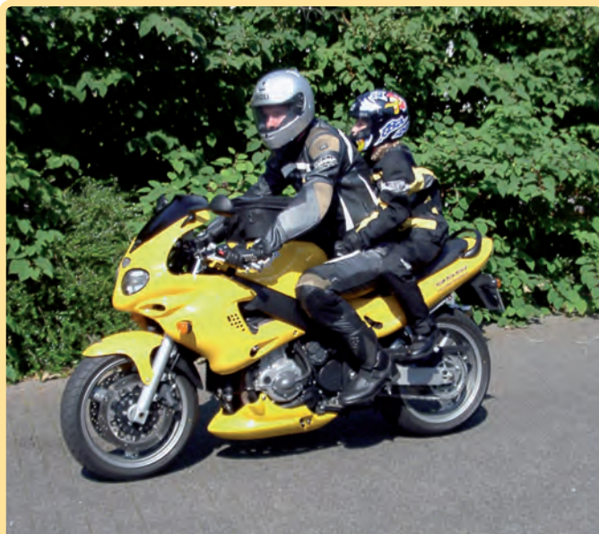
Das sitzt richtig: Füße mit festem Halt auf den Rasten, Hände an den Fahrerhüften.

Trennung von Maschine und Fahrer das Verletzungsrisiko minimieren.