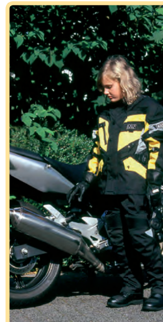
Heiße Kiste: Nicht nur der Mensch, auch die Maschine schwitzt – Finger weg!

Denken Sie daran, Ihr Kind auf die hohen Temperaturen von Motor und Abgasanlage aufmerksam zu machen. Warnen Sie ausdrücklich davor, Auspuff oder Motor anzufassen. Fordern Sie Respekt, aber fördern Sie nicht die Angst!