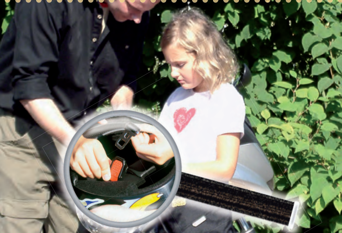
Übung macht den Meister: Kleine Passagiere müssen mit den Eigenschaften der Ausrüstung vertraut gemacht werden. Das schafft Selbstvertrauen.

„etwas zu sagen“ hat. Dabei möglichst wenige Zeichen verwenden – Kinder können sich bei körperlicher Anstrengung nur wenig merken. Am besten klopf Ihnen Ihr Co-Pilot mit der Hand auf den Oberschenkel. Dieses Zeichen signalisiert: „Bitte anhalten“. Machen Sie dem Kind klar, dass es bei der „Zeichengebung“ weniger Halt hat. Am besten die Zeichensprache vorher üben. Moderne Kommunikationshilfen (Gegensprechanlagen) sind hier natürlich eine willkommene Ergänzung um auch unterwegs Sorgen und Ängste zu nehmen, aber auch den Fahrspaß zu teilen.