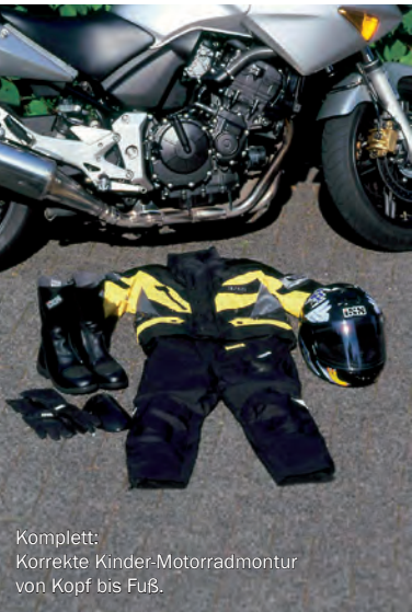
Komplett: Korrekte Kinder-Motorradmontur von Kopf bis Fuß.

in nahezu allen gängigen Kindergrößen. Und dies ist das Maß der Dinge, auf das nicht verzichtet werden sollte. Mehr zum Thema „Motorradbekleidung“ erfahren Sie in der ifz-Broschüre „Motorradbekleidung von Kopf bis Fuß – Schutz ohne Kompromisse“.