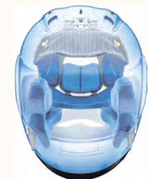
Innenpolster: Einige Hersteller bieten die Möglichkeit eines auswechselbaren Innenpolsters, so dass der Helm „mitwachsen“ kann.

Grund: Im Kindesalter ist der Kopf überproportional groß, zusätzlich erweitert der Motorradhelm Kopfumfang und -gewicht erheblich. Bis zu 1.500 Gramm kann ein Exemplar wiegen, das als „Kinderhelm“ im Handel angeboten wird.