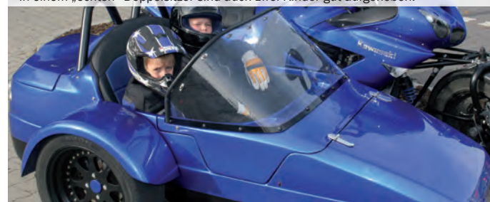
Familientauglich: In einem „echten“ Doppelsitzer sind auch zwei Kinder gut aufgehoben.

Deshalb: Nur dann nebeneinander sitzen, wenn das Boot breit genug ist. Reine „Einsitzer“ sollten nur von einer Person genutzt werden, auch wenn das Kind noch so klein ist. Der oder die „Dritte im Bunde“ gehört auf den Soziussitz.