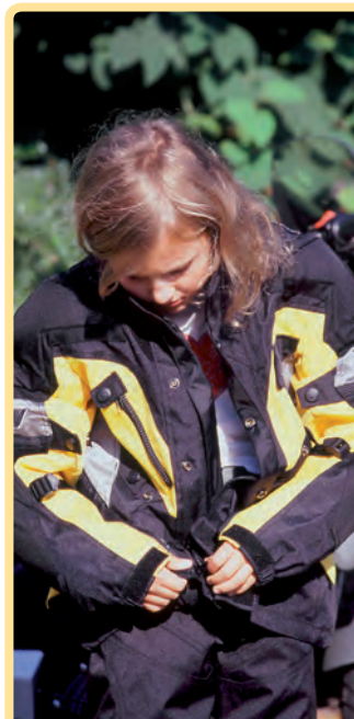
Ablegen und entspannen: In der Pause und nach der großen Tour einmal richtig durchlüften.

Auch wenn Sie selbst Beschleunigung erleben möchten: Nutzen Sie das Beschleunigungspotenzial Ihrer Maschine nicht aus. Sie müssen sich Ihrem Kind gegenüber nicht als Racing-Pilot in Szene setzen – Ihr Sprössling mag Sie auch so. Fahren Sie ausgeglichen, vorausschauend und defensiv. Für den kleinen Passagier spielt „Highspeed“ keine Rolle, denn instinktiv kennt der Nachwuchs die wahren Geheimnisse des Bikens – Fühlen, Riechen, Sehen, Genuss. Ein entspanntes Gleiten ohne viele Gangwechsel nimmt Ihrem Kind körperlichen und seelischen Stress.