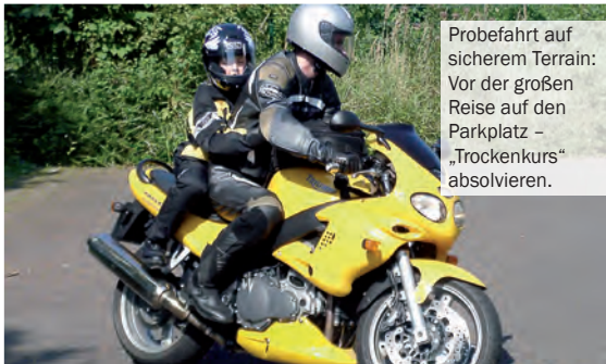
Probefahrt auf sicherem Terrain: Vor der großen Reise auf den Parkplatz – „Trockenkurs“ absolvieren.

fend ein, wenn's mal klemmt, aber sorgen Sie dafür, dass Ihr Sprössling von Anfang an selbstständig agiert. Das gibt ihm „Sicherheit“. Das gilt besonders für das Auf- und Absetzen des Helms. Weiß der Kleine selbst, wie's geht, wird er sich im Helm nicht „weggeschlossen“ vorkommen. Erläutern Sie die Eigenheiten der „einspurigen“ Fahrdynamik. Weisen Sie auf Beschleunigungs- und Verzögerungsverhalten hin, vor allem auf die Schräglage. Kinder sind auf diesem Gebiet übrigens Naturtalente, die wie von selbst „richtig herum“ in die Kurve fallen – vorausgesetzt, sie sind entspannt.