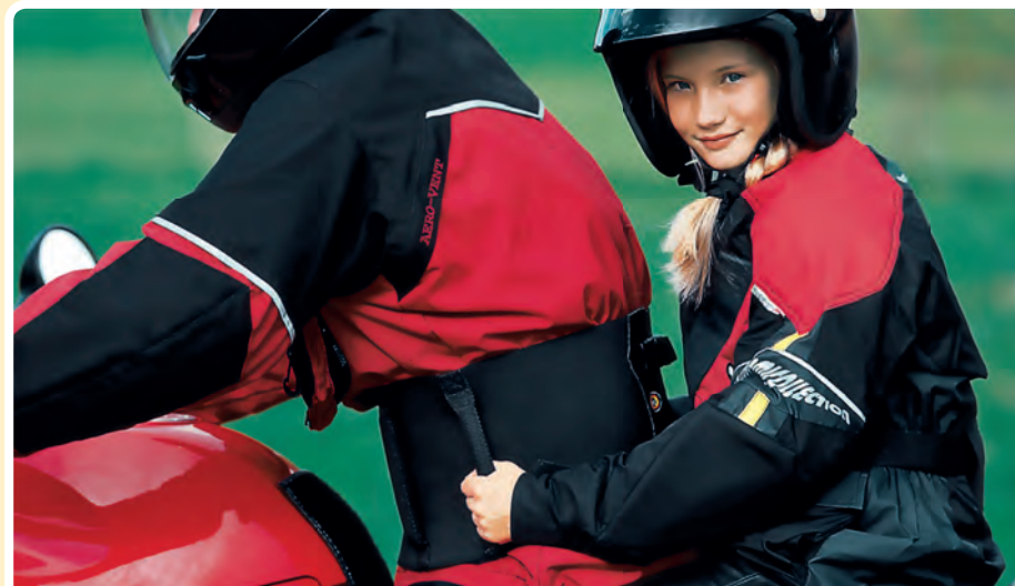
Der besondere Gurt mit integrierten Haltegriffen: So kann sich der kleine Sozius sicher festhalten. (Fotoaufnahme „im Stand“. Während der Fahrt sollte der Sozius stets mit Handschuhen ausgestattet sein.)

Guten Halt und somit Wohlbefinden schafft ein spezieller Gurt. Dieser wird über der Bekleidung des Fahrers angelegt und besitzt an beiden Seiten Haltegriffe für den Sozius (s. Foto rechts).